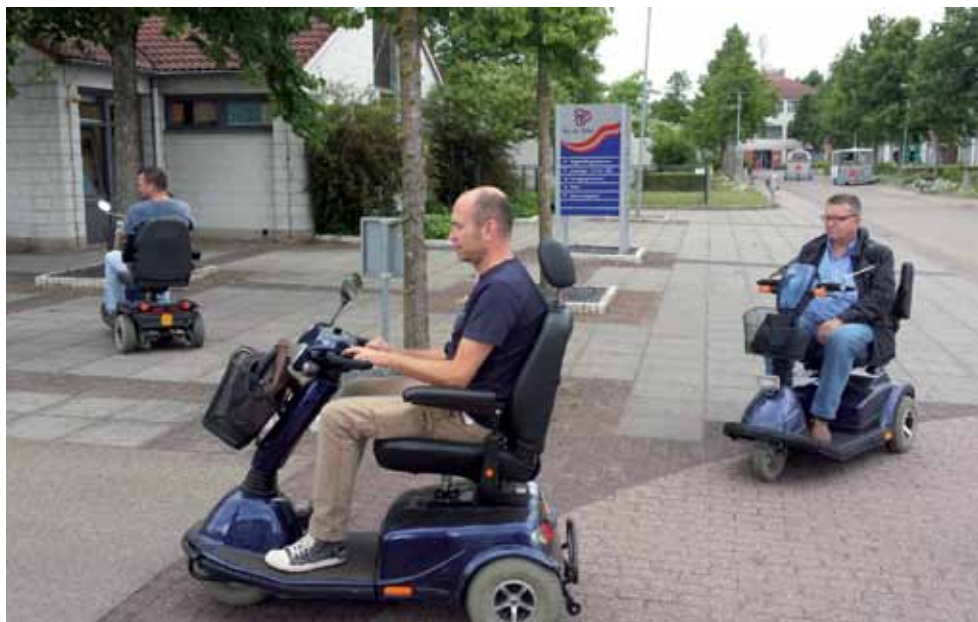
Een aantal cursisten in de trainingstuin

Na uitleg over de bediening van het scootmobiel, leert u op het parcours praktische vaardigheden voor binnen en buiten. U leert rijden op verschillende soorten bestrating en een hellingbaan. En