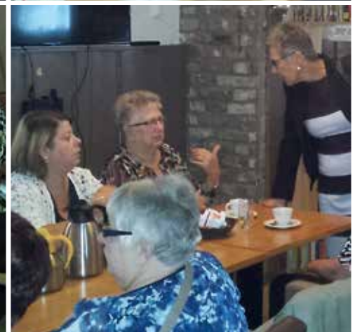
Aan tafel met onze trouwe huurders in 2016