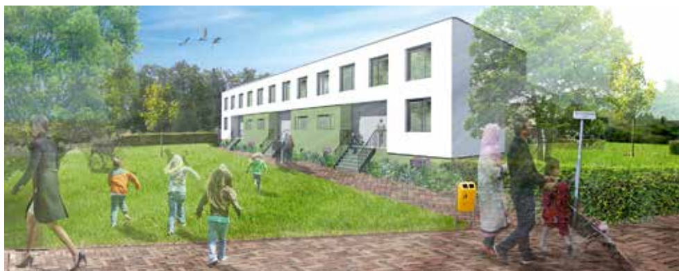
Impressie van hoe de woningen er ongeveer uit komen te zien